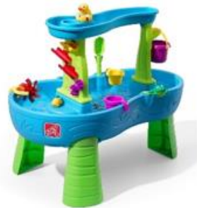
Step 2 watertafel